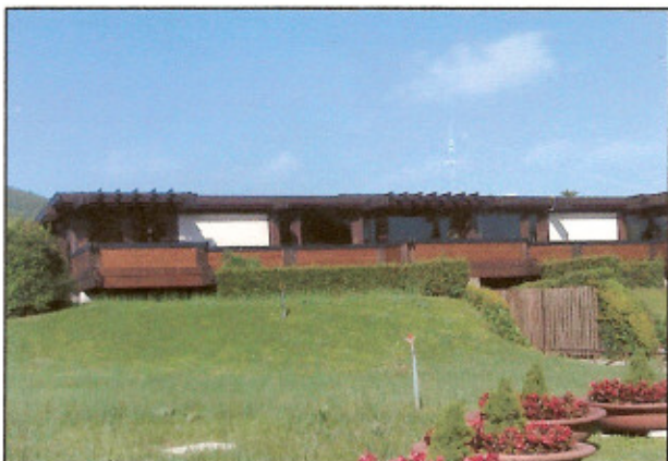
IL CENTRO INSIEME UGUALI